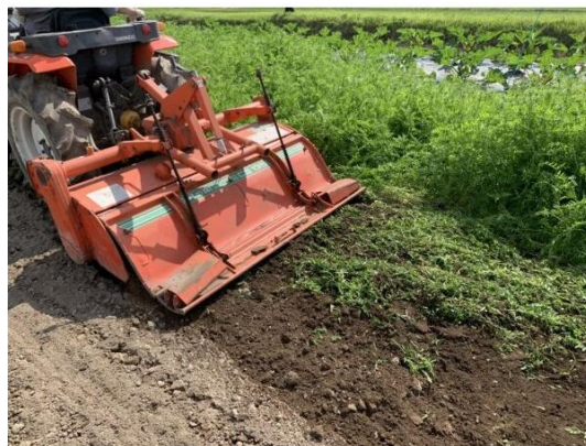
図 7.ヘアリーベッチのすき込み (長野県 HP より引用)