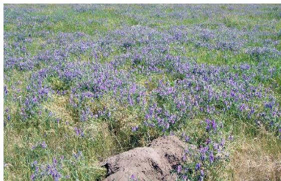
図 2. 休耕地に栽培されるヘアリーベッチ