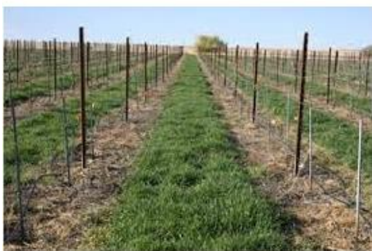
図 1. ブドウ園に栽培されるヘアリーベッチ

ヘアリーベッチは冷涼の環境を好み、耐寒性が強く、生長が早いので、晩秋と早春の栽培に適する。根粒菌による窒素固定力が高く、茎葉が柔らかく、すき込んだ後の分解が早いいため、土壌流出防止と水分保持、土壌改良などの目的で、果樹園や収穫後の水田、野菜畑に播いて、生長させ、リビングマルチとして地表を覆わせる緑肥として適している。図 1 と図 2 はブドウ園と休耕地にリビングマルチとして栽培されるヘアリーベッチの写真である。