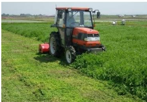
図 6. ヘアリーベッチの細断 (新潟県 HP より引用)

茎葉を地表に残して、リビングマルチの効果を続かせる。雑草化の心配がない場合は刈取りもせず、そのまま放置して、7~8月に自然に枯れて死んでしまう。この場合は結実した種が地面に落ちて、10~11月に発芽して生長するので、播種が不要である。