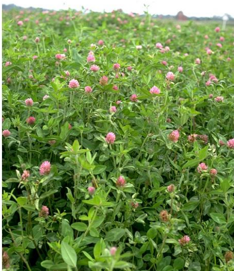
図1. 開花期のアカクローバ (オレゴン州立大学より引用)

アカクローバは晩秋～早春播きの春作緑肥として、同じマメ科のヘアリーベッチに比べて、初期生長が遅く、粗有機物生産量が低いが、根は強い直根と多数の繊維根からなり、根圏が広く深く、根粒菌による窒素固定力が高い。また、ダイズシストセンチュウの抑制効果が高く、茎葉が柔らかく、すき込んだ後の分解が早い。5月中旬～7月上旬に開花し、ピンク～赤の球状花は観賞用として人気がある。従って、線虫抑制と土壌改良などの目的で、収穫後の水田、野菜畑、休耕地に播いて、生長させ、景観美化に役立つ緑肥としては適している。図1はアカクローバの植株、図2はアカクローバ根に共生している根粒の写真である。