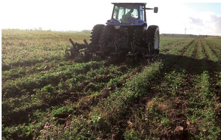
図 6. アカクローバのすき込み

アカクローバは草丈が低く、茎葉も柔らかいので、すき込み作業は、茎葉を細断する必要がなく、ロータリーかプラウを使って直接に土にすき込む。図 6 はアカクローバのすき込み写真である。