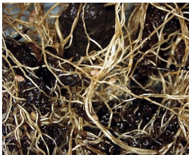
図2. アカクローバ根の根粒