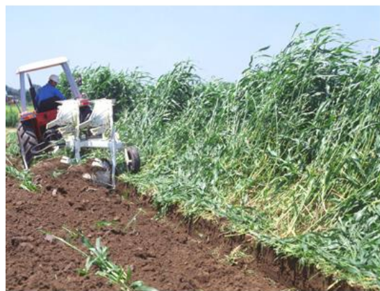
図 4. ソルガムのすき込み作業 (カネコ種苗より引用)

すき込み作業は、まず、ハンマーナイフモアとロータリーナイフモア、ストローチョッパーなどを使って、地上部の茎葉を裁断してからロータリーかプラウですき込む。特に茎の太い兼用型ソルガムとやや細いスーダン型ソルガムは必ず茎葉を 5～10cm 以下に細断した後ですき込む。草丈が低く、茎の極細いスーダングラスはそのままロータリーかプラウですき