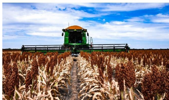
図6. ソルガムの子実収穫