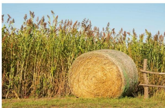
図5. ソルガムのロールサイレージ

サイレージは収穫と調製方法により、ロールベールラップサイレージと細切サイレージに大別される。ロールベールラップサイレージの収穫は、ほとんど細断型ロールベールを使用する。1台で収穫、切断、ロール梱包など全工程をまとめてできるので、作業効率が良く、本邦ではこの方法が主流である。図5はロールサイレージの写真である。