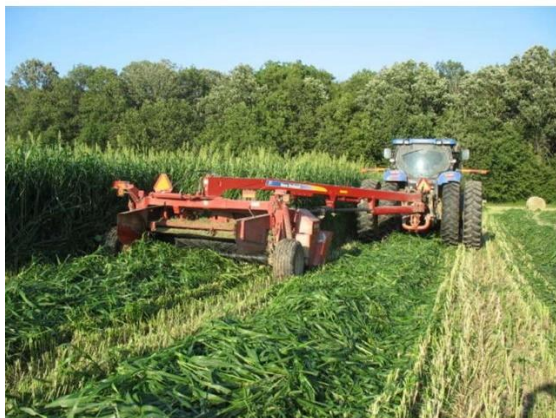
図 3. ソルガムの裁断作業

すき込みは茎の伸長が止まり、葉の展開もほぼ終了する止葉期～出穂期に行う。この時期は株が草丈 1.5～2.5m に成長して、茎葉の最大生育量に達したので、10a あたりに 3～6 トンの粗大有機物が得られる。また、全生育期間に必要な窒素養分の 70%、りん酸養分の約 60%、加里養分の 80%がすでに吸収されている。