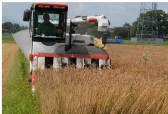
図 6. 自脱コンバインによる小麦収穫