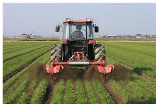
図5. 中耕培土作業