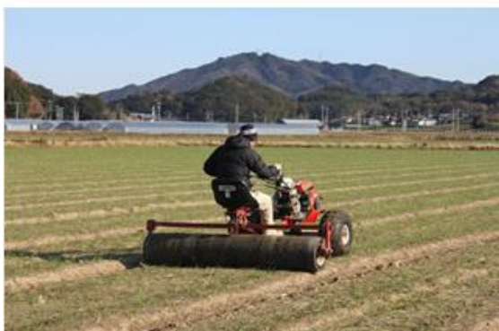
図4. 麦踏み作業

麦踏みの効果は① 徒長生育を抑え、耐寒力を強くし、分けつを促進する。② 苗の下位節間の伸長を抑制し、出穂開花後の倒伏を防止する。③ 土を固めて、冬春期の霜柱発生による根の立ち上がり及び土壌乾燥を防止する。④ 幼穂形成を遅らせ、春先の低温による凍霜害を防止する。